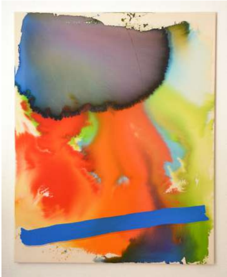
Hazel Ann Watling D'PAK & OPRAH 3 2020 aquarelle, encre et acrylique sur toile (coton) sur châssis, vernissé à la bombe (UV protection mat) 10 x 80cm