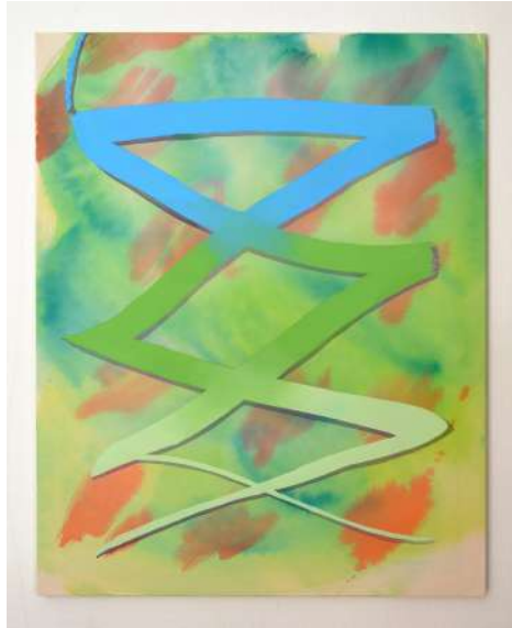
Hazel Ann Watling D'PAK & OPRAH 6 2020 aquarelle, encre et acrylique sur toile (coton) sur châssis, vernissé à la bombe (UV protection mat) 10 x 80cm